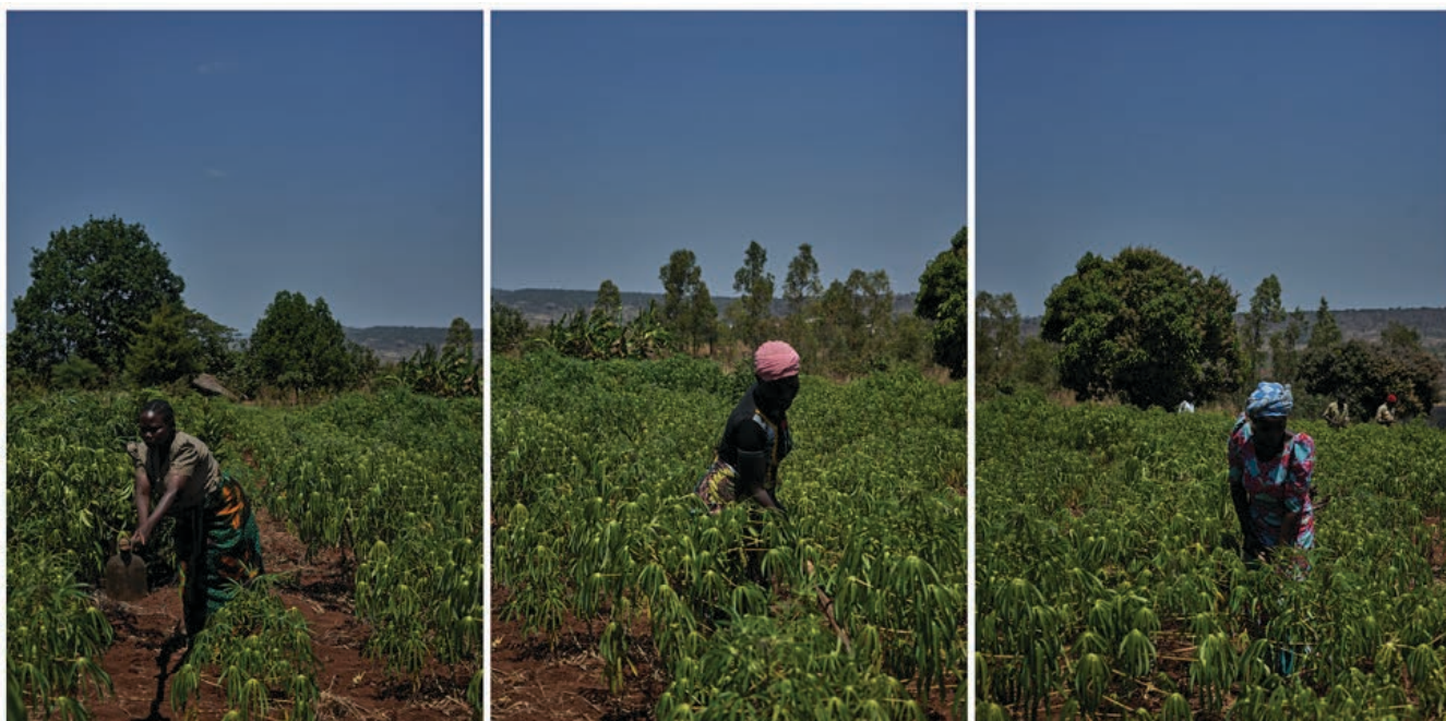
一片綠油油的木薯田，為貧農帶來脫貧希望。參與木薯種植的農民，頂著烈日，辛勤耕種，展現生命的韌力。