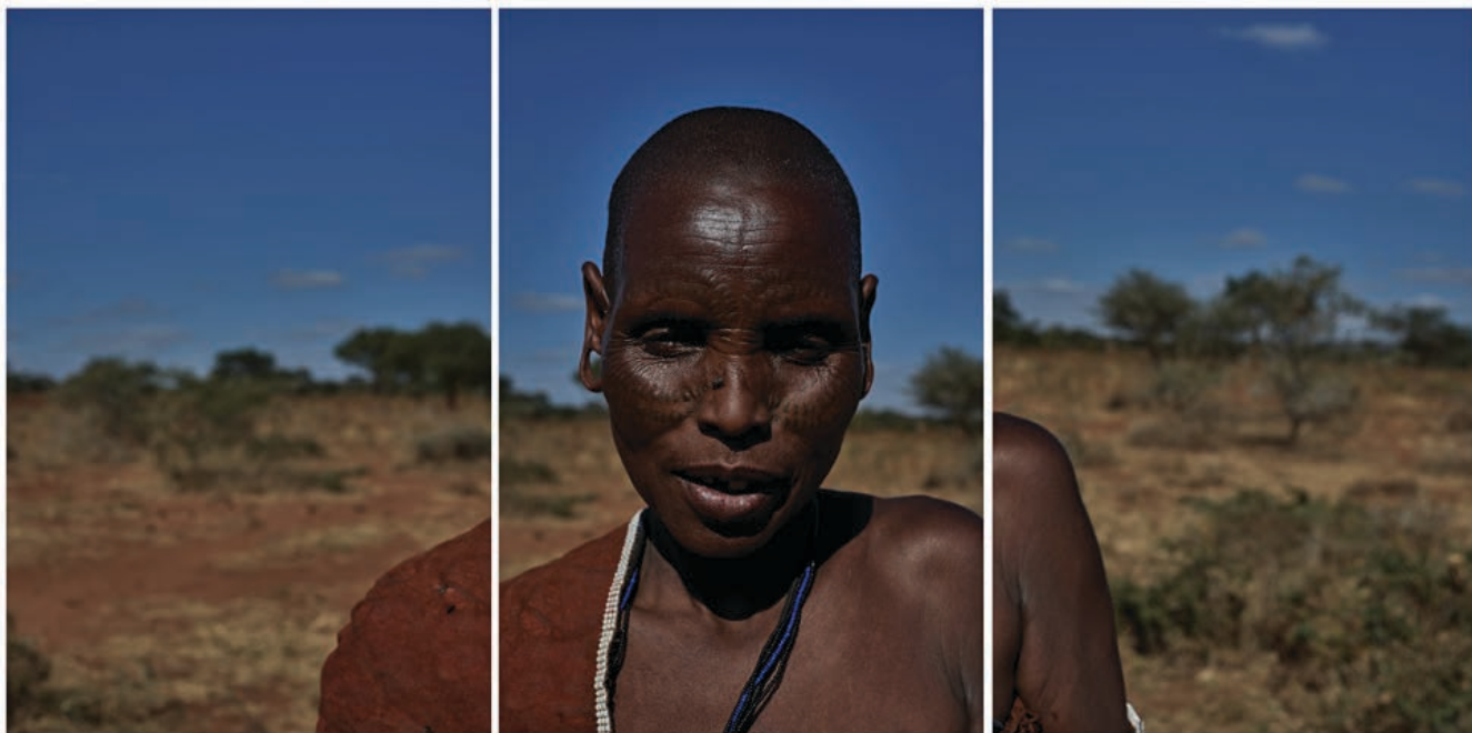
難忘游牧民族婦女如刀削般堅毅的面孔——似在無言訴說生活的滄桑。