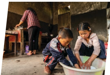
我和弟弟幫奶奶洗碗。