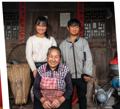
我、奶奶和哥哥在家門前合照。