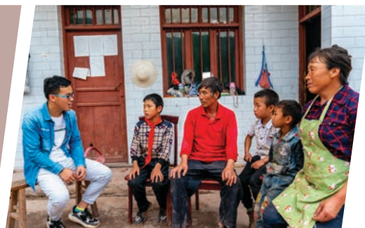
我經常家訪，了解留守孩子的生活。