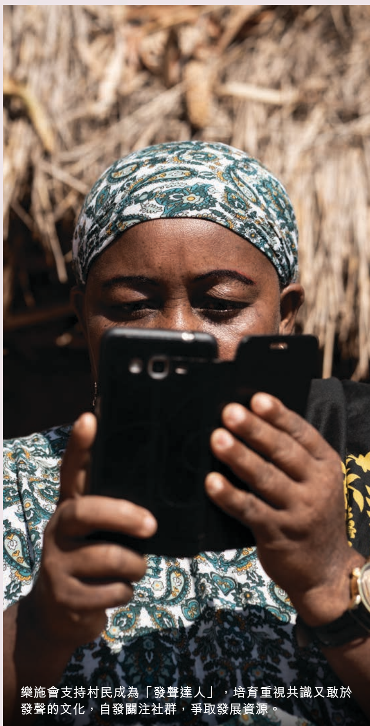
樂施會支持村民成為「發聲達人」，培育重視共識又敢於發聲的文化，自發關注社群，爭取發展資源。

一位大媽發聲達人說：「以往任何事情只能在村會議上投訴，說完，就完了，無下文。」現在，縱使網絡不算快，但總算能接通天地，對村民來說，簡直是跳過幾重衙門，跨過幾千里土地，直通天庭。